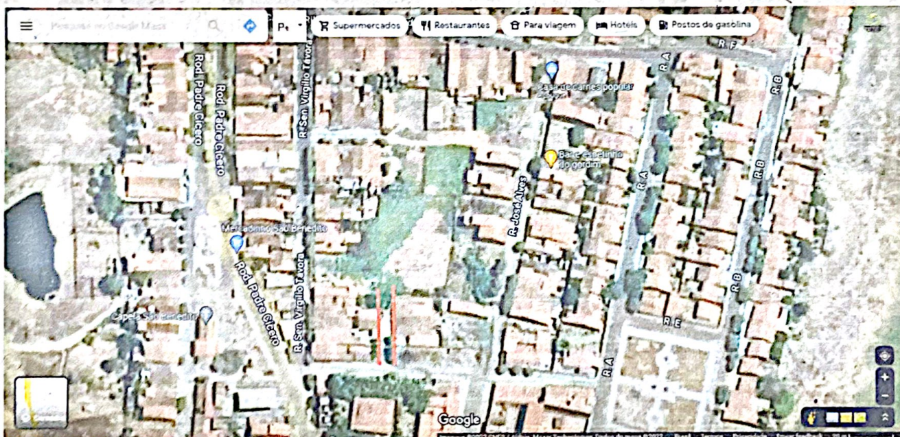
marcação em vermelho da Localização.

Não teve oportunidade de estudar, mas trazia consigo sua sabedoria popular, o mesmo era uma pessoa muito trabalhadora e gostava de ajudar as pessoas mesmo com poucas condições financeiras, tinha o prazer de servir o próximo, era uma pessoa que gostava de aconselhar, sempre quando havia conflitos na vizinhança ele estava tentando apaziguar, faleceu aos 60 anos de idade deixando um legado de muitas amizades e grandes ensinamentos.